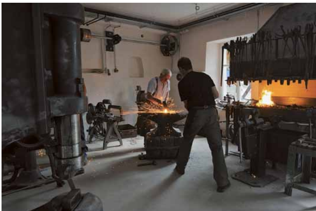
In der Esse lodert das Feuer und auf dem Amboss sprühen die Funken: In der neu erstellten Schmiede wird schon wacker gearbeitet.