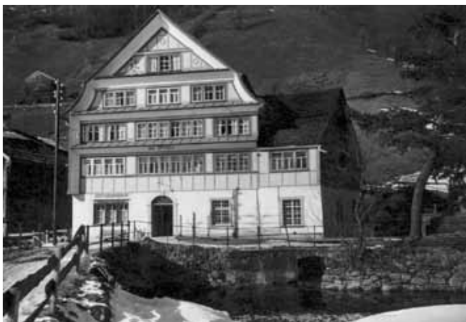
Das Haus zur Mühle in Alt St.Johann auf einem Bild unbekanntes Datums.

1561 wird ein neuer Lehensvertrag abgeschlossen, jetzt aber ausgestellt im Namen des Fürstabtes. Darin werden Mängel vermerkt wie zum Beispiel, dass der vorherige Müller «hinderruckhs» einen Backofen eingebaut habe. Die gesamte Müllerei-Einrichtung erfährt eine peinlich genaue Inventur. Da jetzt die St. Gal-