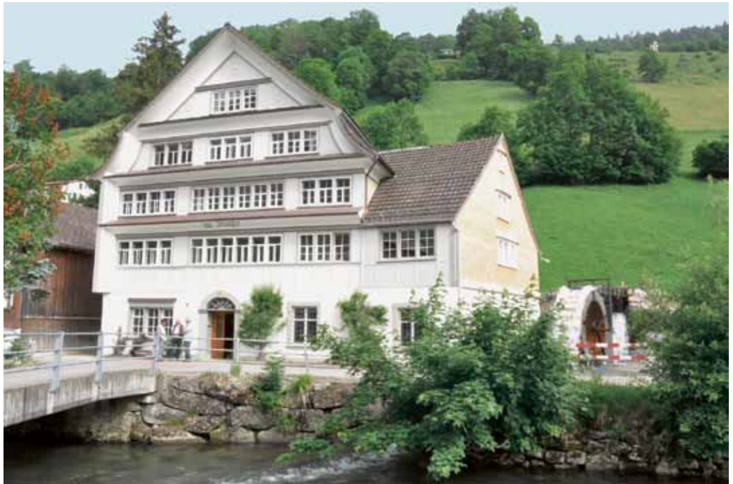
In neuem Glanz: Die Klangschmiede der Klangwelt Toggenburg.

Über die Geschichte dieses stattlichen Hauses ist eigentlich nur wenig bekannt. Der Ebnet-Kappler Historiker Jost Kirchgraber hat die Geschehnisse zu einer Publikation aufgearbeitet, die just zur Eröffnung der Klangschmiede erschienen ist und aus der hier im Folgenden zitiert wird. Urkundlich erwähnt wird ein Haus zur Mühle, sonnenhalb an der Thur in Alt