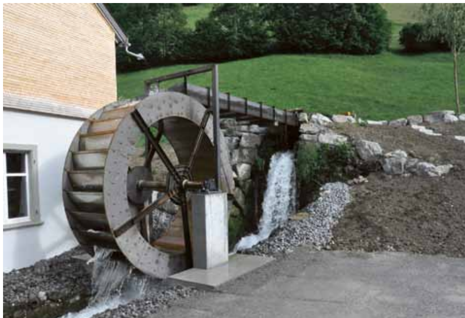
Das neue Wasserrad: Treibt die Transmission an und erzeugt eine maximale Leistung von 6,3 kW.