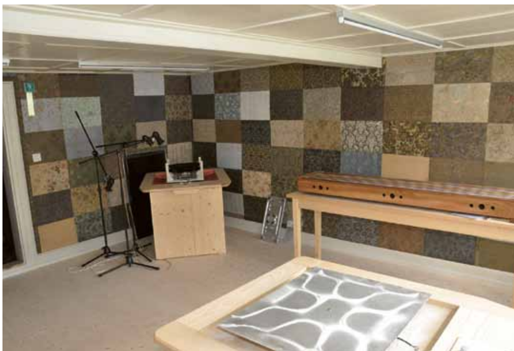
Aus dem Tapetenzimmer ist das Klangzimmer geworden: Hier entstehen Wasserklangbilder, wird das Monochord erklärt und auf der schwingenden Metallplatte spielt der Sand.

Kirchgraber, Jost, Ebnetter-Kappel: Von der Klostermühle zur Klangschmiede, 2011. www.klangwelt-toggenburg.ch