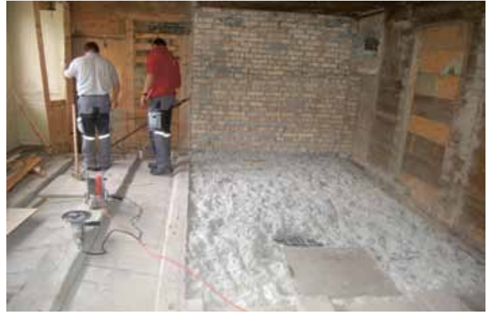
... dann kamen die Handwerker und entfernten, was nicht mehr gebraucht wurde ...

hört, für 2700 Gulden kaufen. Von jetzt an ist sie Privatbesitz. Der «jeweilige Besitzer» muss aber «zu allen Zeiten ... dem Gottshaus 10 Tremmel Holz zu Tihlen oder Brettern, wie wirs nötig finden, umsonst und unentgeltlich sägen oder sägen lassen». Bereits ein halbes Jahr später erübrigte sich jedoch, wie man weiss, diese Auflage. Logischerweise heisst die Mühle von jetzt an nicht mehr Herrenmühle , sondern Untere Mühle . Ab 1798 waren die Herren abgeschafft. In sutterschem Familienbesitz blieb nun die Untere Mühle aber 50 Jahre lang.